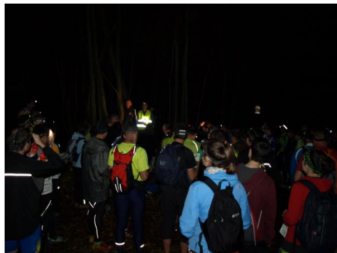
Briefing avant le départ.

Les dieux du ciel, et non du stade, furent cléments car le temps était doux et sec en cette soirée du 5 novembre. Mais la pluie de la journée avait bien détrem্পé les sous-bois et la boue était bien présente.