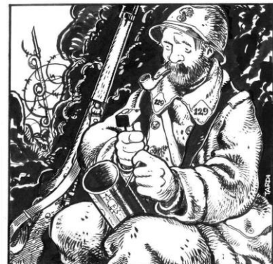
Dessin de TARDI

Les Glanois n'ont pas oublié de rendre hommage et respect à nos concitoyens morts pour la Patrie au cours de la Première Guerre Mondiale.