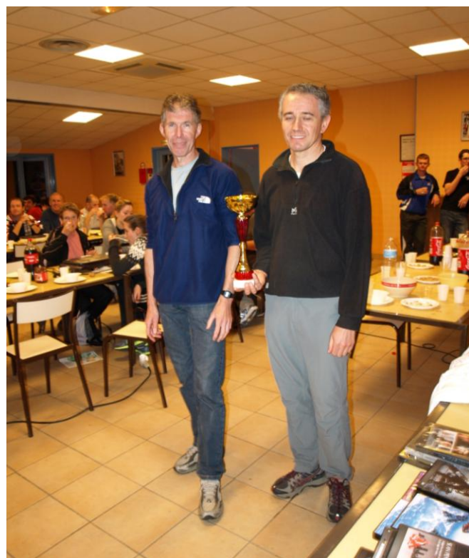
Les vainqueurs de l'épreuve.

Après plus de trois heures d'épreuve, c'est vers 22h30 que les concurrents se retrouvèrent au Foyer Rural pour la remise des prix.