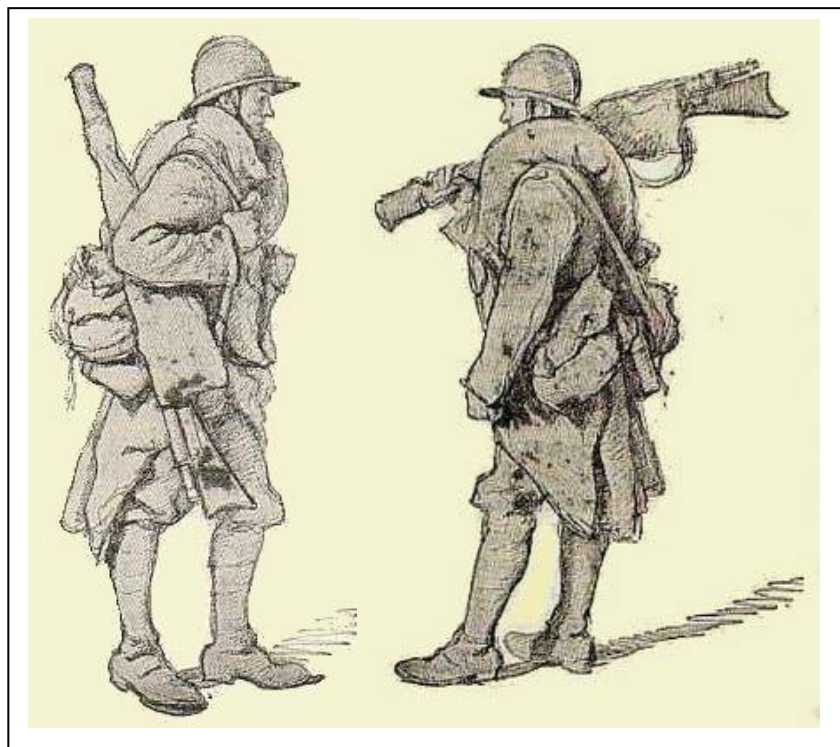
Lissac : Croquis de poilus guerre 1914 – 1918